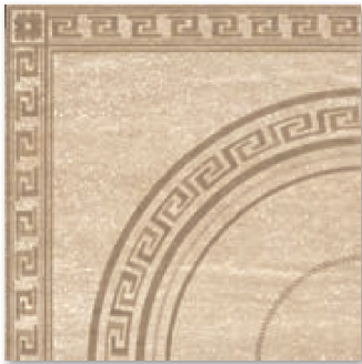
6646-0009 Travertine SET bej/beige | mat/matt