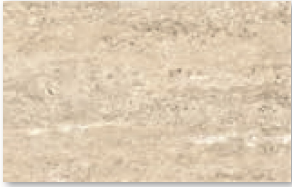
2042-0365 Travertine bej/beige | mat/matt