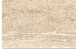
2642-0449 Travertine bej/beige | mat/matt