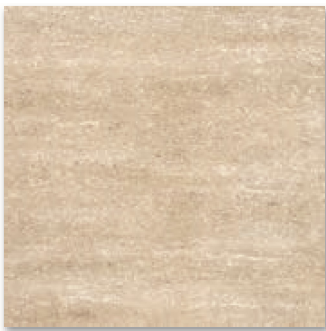
6046-0131 Travertine bej/beige | mat/matt