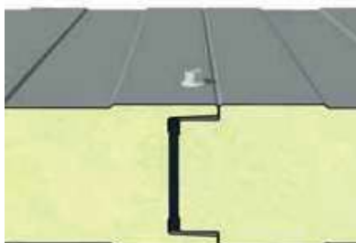
Detaliul fazei de montaj