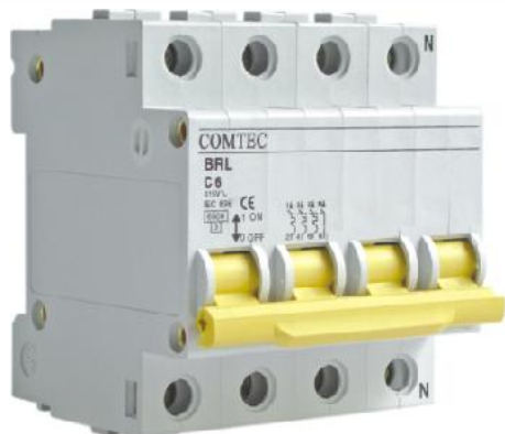
Caracteristica de declansare C