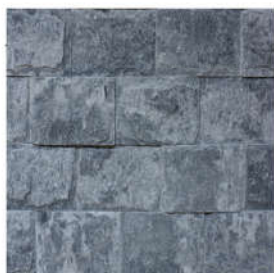
Natimur Terra Grey