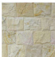
Natimur Terra Cream