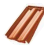
Tiğlă de margine dreapta