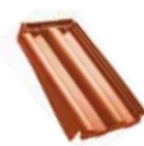
Tiğlă de margine stânga