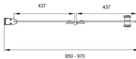
EC12100FL - Montaj Stanga 95-97x195cm