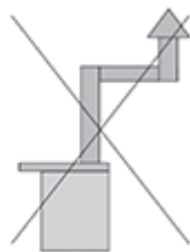
MONTAJ INCORECT HORN IMPROVIZAT