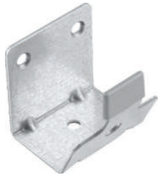
Element de ghidare inferior pentru ușă exterioară