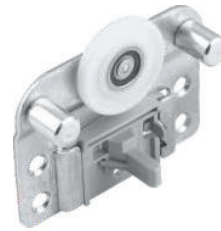
Element de rulare superior pentru ușă interioară