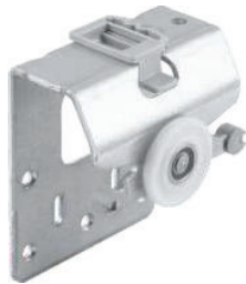
Element de rulare superior pentru ușă exterioară