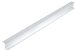
Profil de rulare superior