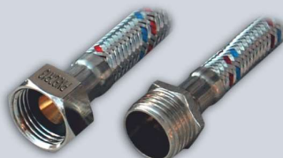
1/2 - Np , L 30-60 cm