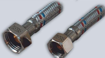
1/2 - 3/8 , L 30-60 cm