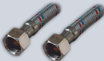
3/8 - 3/8 , L 30-60 cm