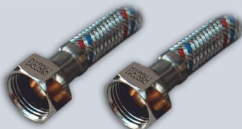
1/2 - 1/2 , L 30-200 cm