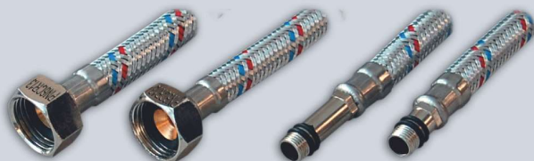
monobloc 1/2-1/4, L 40-50-60-80-100 cm

Caracteristici tehnice si materiale PT. RACORD FLEXIBIL