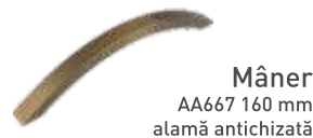
Mâner AA667 160 mm alamă antichizată