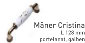
Mâner Cristina L 128 mm porțelanat, galben

Disponibil în cele patru nuanțe corespunzătoare!