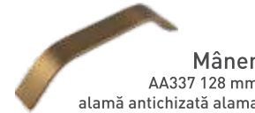
Mâner AA337 128 mm alamă antichizată