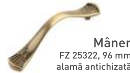
Mâner FZ 25322, 96 mm alamă antichizată