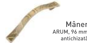
Mâner ARUM, 96 mm antichizată