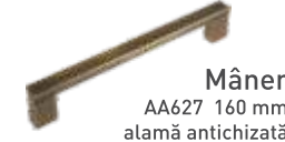
Mâner AA627 160 mm alamă antichizată