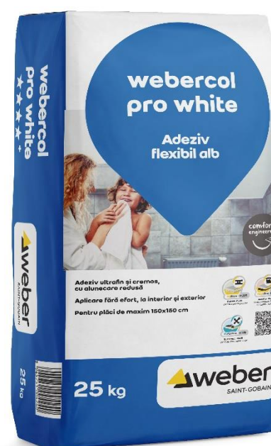
Sac 25 kg