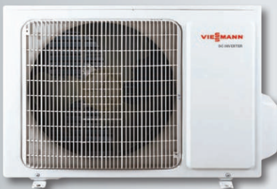
Unitatea externă Vitoclima 200-S/HE