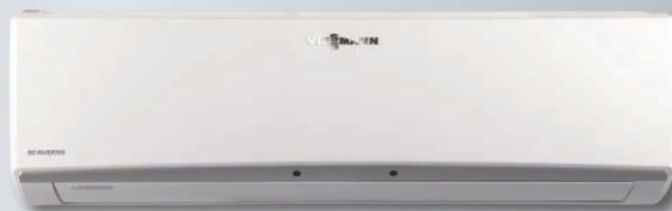
Unitatea internă Vitoclima 200-S/HE