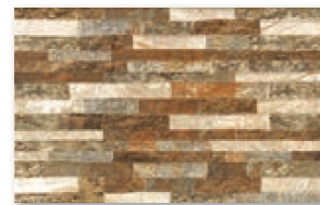
2042-0522 Carving bej/beige | mat/matt