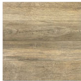
6046-0136 Norway grej/greige | mat/matt