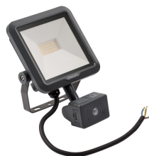
LED Module, system flux 900 lm