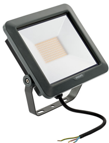
LED Module, system flux 4500 lm - LED - 100°