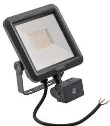
LED Module, system flux 2500 lm